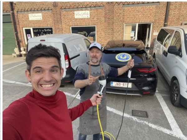
Hannes Coudenys & Henk Rijckaert © Hurae

De actie past in de nieuwe strategie van Jaguar om tegen 2025 enkel nog zuiver elektrische wagens op de markt te brengen.